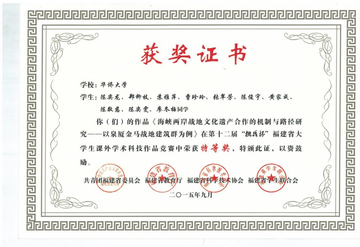
图 3: 香港研究生陈奕龙、郑柳枝福建省挑战杯特等奖获奖证书