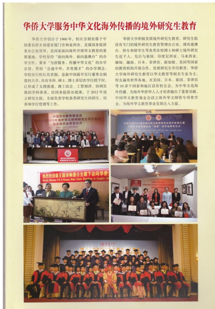
图 15：华大境外研究生教育在《中国行政管理》杂志宣传