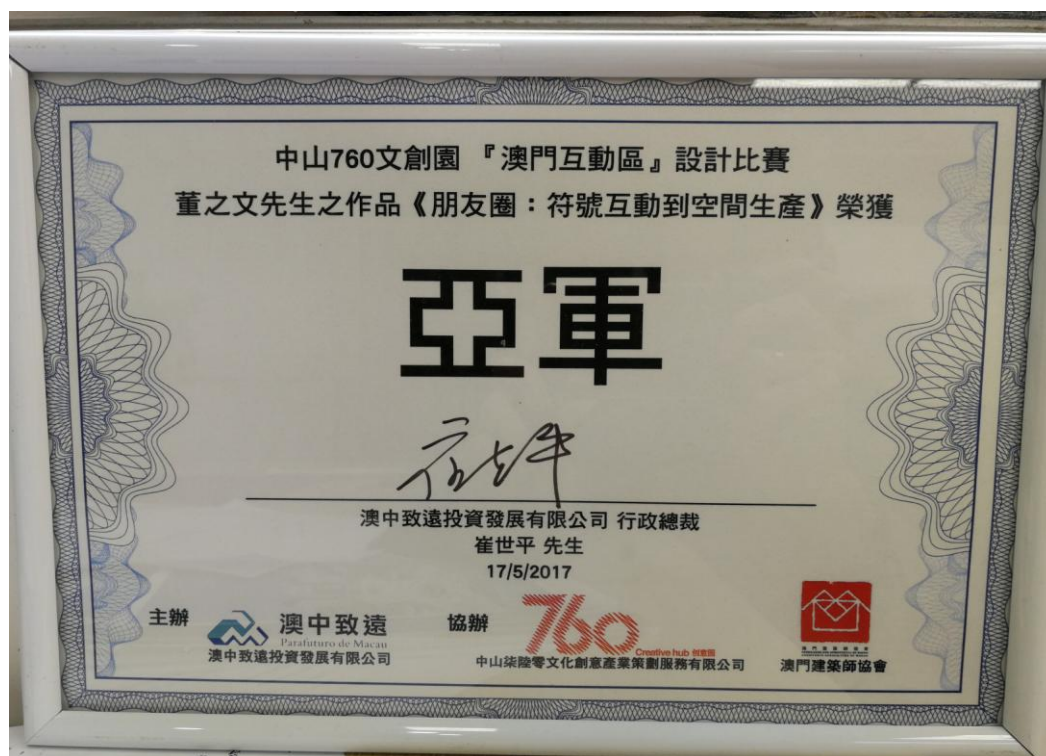
图 2：澳门研究生董之文专业比赛 2017 年获奖证书