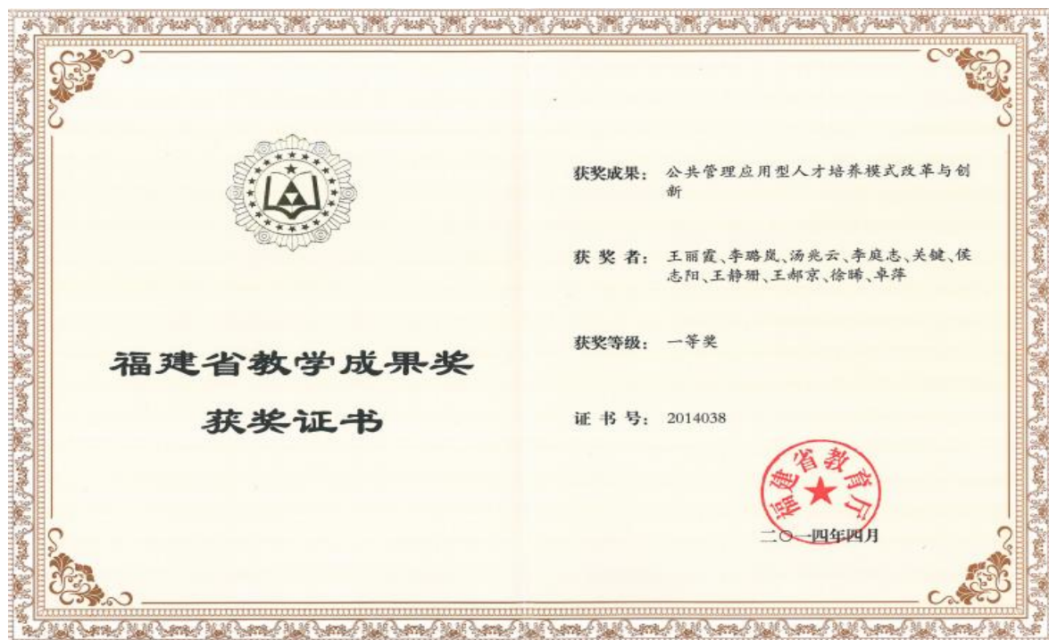
图 24：王丽霞 2014 年省级教学成果奖一等奖证书