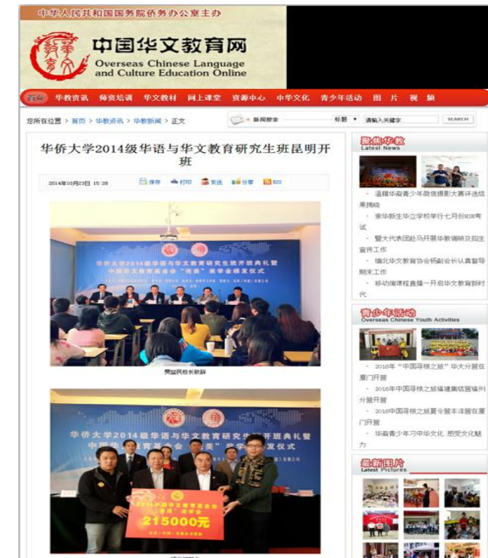
图 16-19：境内媒体对我校境外研究生教育的部分报道