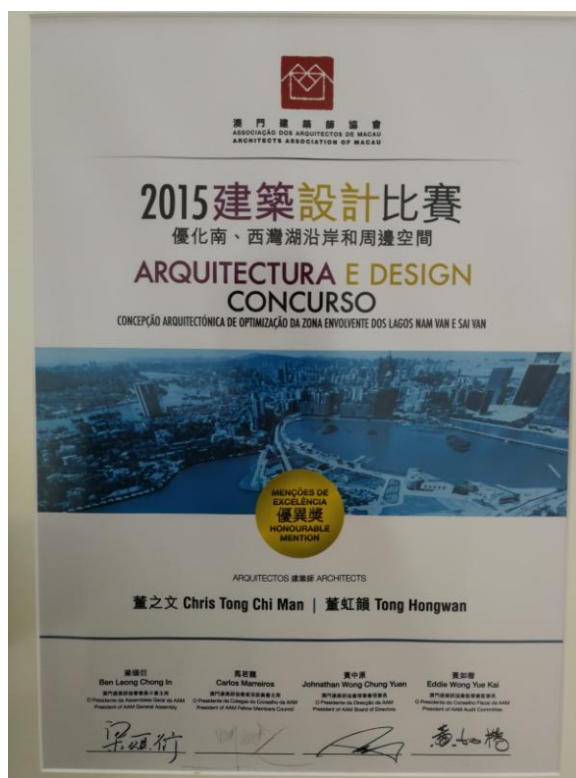
图 1：澳门研究生董之文专业比赛 2015 年获奖证书