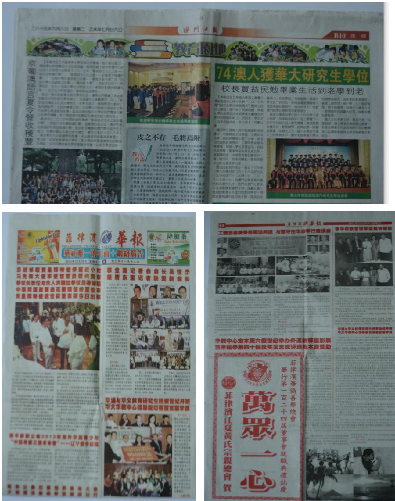
图 20-23: 境外媒体对我校境外研究生教育的部分报道