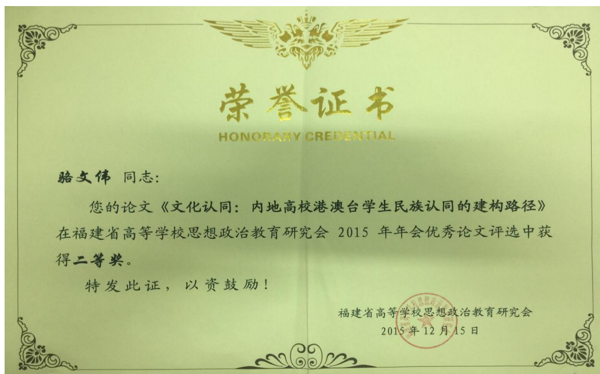
图 25：骆文伟 2015 年省思政教育年会优秀论文二等奖证书