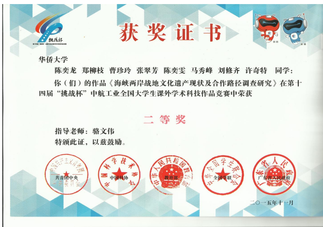
图 4: 香港研究生陈奕龙、郑柳枝全国挑战杯二等奖获奖证书